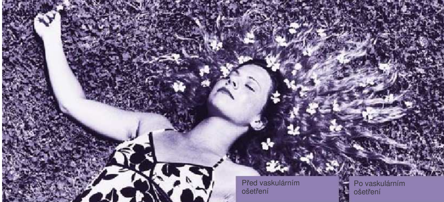
Před vaskulárním ošetřením