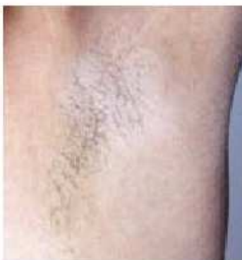
Po odstranění chloupků