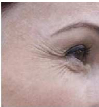
Po ošetření vrásek