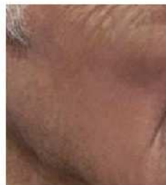
Před hyperpigmentačním ošetřením