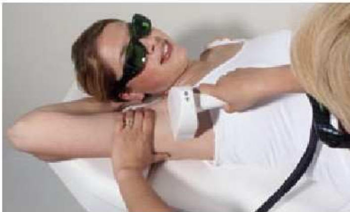
Před odstraněním chloupků

Omlazení pleti zahrnuje ošetření vrásek. Velmi specifickým ošetřením IPL můžete ošetřit malé plošky pleti a redukovat hloubku vrásek a kompletně odstranit jemné linie. Zde je pleť také specificky stimulována k tvorbě kolagenu, takže je pevnější a vrásky se vyplní zevnitř. Znovu pleť začne pracovat sama zevnitř bez aplikace chemických látek.