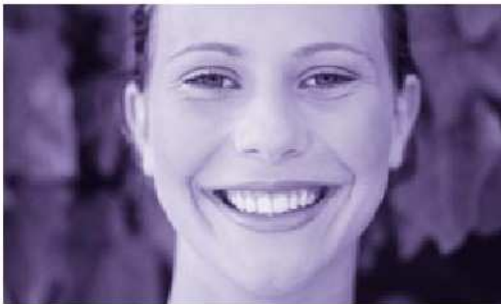
Před ošetřením vrásek